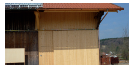
Zwischen den beiden Toren kann man nun über eine Treppe den oberen Stock erreichen.