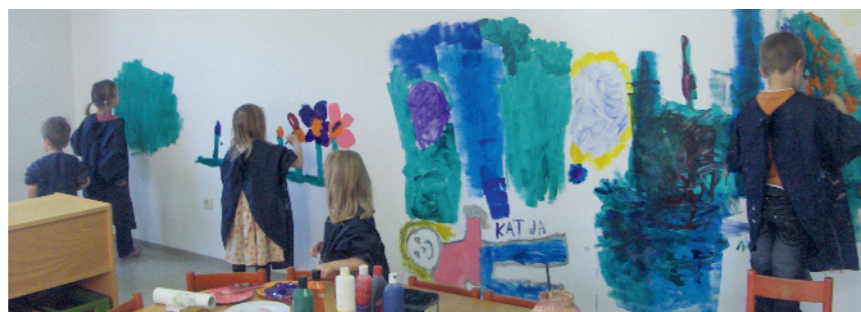
Das gib es auch nicht jeden Tag, aber das Anmalen der Wände hat allen Spaß gemacht.

ren so alles ansammelt. Bei den Arbeiten an der Erweiterung des Gewerbegebiets haben sich Verzögerungen ergeben. Dies behindert jetzt natürlich auch die Nutzung der Halle als Kindergarten. Die Eltern und Busfahrer kann ich hier nur um Verständnis bitten. Man kann davon ausgehen, dass die Erschließungsarbeiten wohl noch bis Mitte Mai andauern werden.