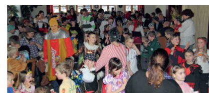
Rammvoll und es hat richtig Spaß gemacht.

»Schon Wochen im Voraus freuen sich die Baisweiler Kinder auf den Kinderfaschingsball in »Drei Rosen«. Eltern werden zu DJ's, Spendensammlern für die Tombola und Organisatoren, um ihren Kindern den gleichen Spaß zu ermöglichen, wie sie ihn selbst schon in ihrer Kindheit hatten. Der Dank der Initiatoren gilt allen Besuchern und Mitwirkenden, den vielen Helfern und dem Gasthaus »Drei Rosen«. Erika Summer