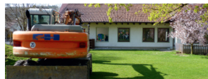
Auge in Auge stehen Kindergarten und Bagger sich gegenüber. Die zwei Fenster rechts werden zum neuen Kindergarten Eingang.

Als sich der Gemeinderat Anfang des Jahres 2010 intensiv mit der Thematik »Kinderkrippe« beschäftigte, konnte man noch nicht absehen, was sich daraus an Folgeerscheinungen ergeben würden. Eine Verkettung von Umständen, Regelungen und Terminvorgaben brachte die jetzige Variante zur Planung und Umsetzung. Zum einen wären alleine die nötigen Brandschutzmaßnahmen im Kindergartengebäude auf mindestens 100 000 Euro zu betiteln gewesen und für Sanierungs- und Umbauarbeiten wohl nochmals die doppelte Summe. Wäre diese Lösung favorisiert worden, hätte man zwar zwei Kindergartengruppen und die Krippe gehabt, aber noch lange keine